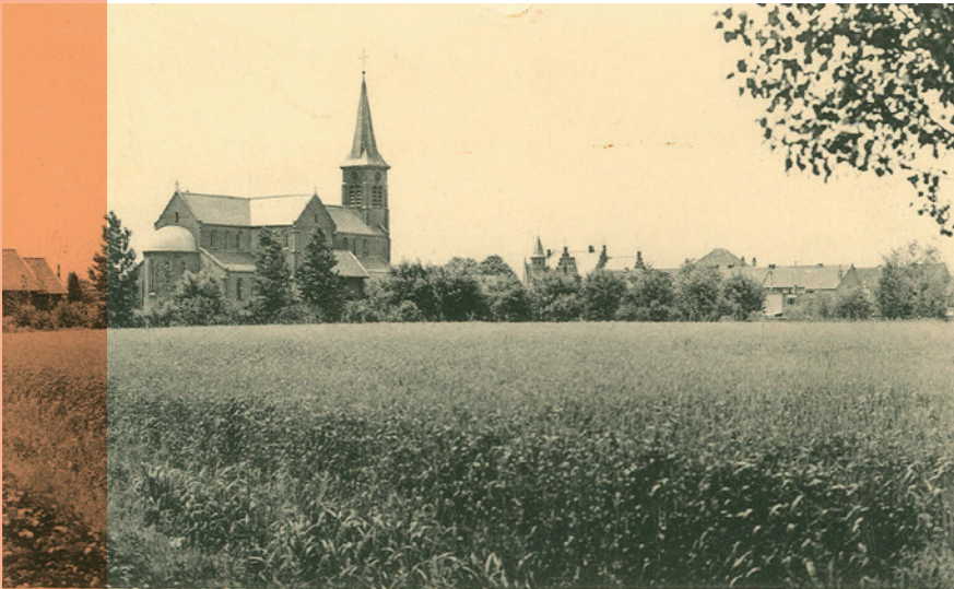
Merelbeke Algemeen Zicht